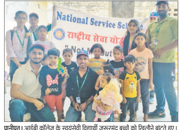
पानीपत। आईबी कॉलेज के स्वयंसेवी विद्यार्थी जरूरतमंद बच्चों को खिलौने बांटते हुए।