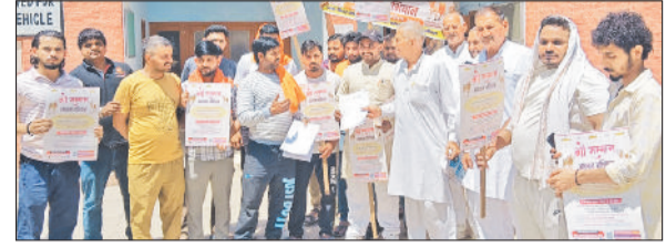
इसराना। गोसेवा परमोधर्म ट्रस्ट व गोशाला प्रबंधन समितियों के सेवक गांव इसराना में जागरूकता रैली निकालते हुए।